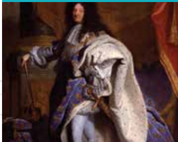
La peinture française