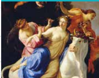
La peinture française