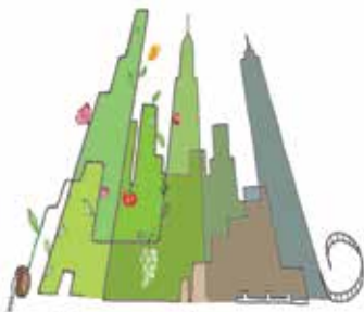
La tournée des potagers

Et si vous n'êtes pas musicien, venez vous dégourdir les oreilles aux sonorités nouvelles des jeunes talents que nous aurons sélectionnés pour vous !