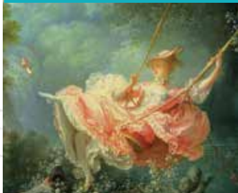
La peinture française